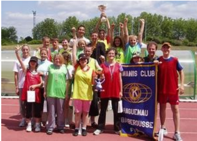
Le trophée des Olympiades 2009 est revenu à l'IMP des Glycines pour la 3e fois consécutive.

Les Olympiades de l'IMP des Glycines se sont déroulées l'autre jour au stade de Haguenau comme chaque année depuis 2006.