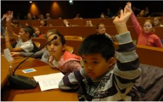
Hier matin, les écoliers de l'Odysée citoyenne ont questionné les adultes sur leurs droits d'enfants. Un riche débat présidé par le maire Roland Ries.

150 élèves de Strasbourg ont investi hier matin la salle des conseils du centre administratif pour l'Odysée citoyenne, lancée par l'association Thémis. C'était l'une des nombreuses célébrations des 20 ans de la convention internationale des droits de l'enfant.