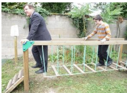
Le pont suspendu constitue l'une des nouvelles installations mises en place à l'institut médico-éducatif des Glycines.