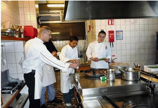
En cuisine, les apprentis cuisiniers s'en donnent à cœur joie.

Parce que partager un bon repas semble être le remède idéal pour tisser des liens et apprendre à se connaître, les adolescents du centre de la Ferme ont eu la riche idée d'inviter les voisins. Au menu : respect, générosité et compréhension.