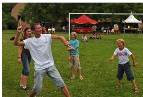
Les enfants ont, une fois encore, adoré apprendre à manier un boomerang avec un pro de la discipline.

Si la météo a nui hier à la quatrième édition de la fête du boomerang, Sport Solidarité Insertion, l'association qui l'organisait, affichait un bel optimisme.