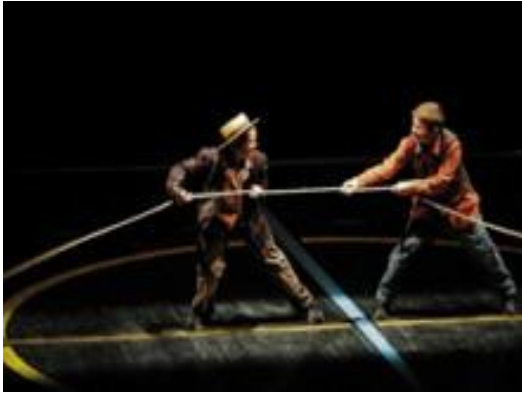
Le spectacle de l'IMP les Catherinettes en 2006.

Le Kiwanis apporte les 4 500 nécessaires pour permettre aux enfants de l'IMP les Catherinettes de continuer à faire du théâtre.