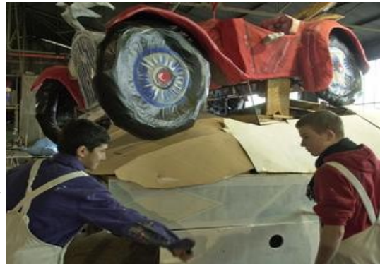
Des jeunes du centre social et culturel du Neuhof ont participé à la réalisation d'un char pour le carnaval de Strasbourg, le 15 mars.