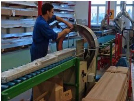
L'ESAT (établissement et service d'aide par le travail) de la Ganzau à Strasbourg, 155 salariés, un des fleurons de l'association ARSEA.

La réforme touche des centaines d'établissements, des milliers d'emplois en Alsace. Les secteurs sanitaire et médico-social - prise en charge des handicapés et des personnes âgées dépendantes - s'inquiètent des conséquences de la réforme annoncée : disparition des DDASS (directions départementales des affaires sanitaires et sociales) remplacées par l'ARS (agence régionale de santé).