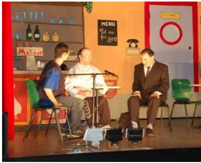
Des sketches improvisés dans un bar imaginaire de la Ganzau. (Document remis)

Le centre d'accueil pour adultes handicapés mentaux, structure d'accueil de jour pour une cinquantaine de bénéficiaires (*), a présenté récemment son spectacle au public de différentes structures médico-sociales et le lendemain aux parents et amis au 23, rue du Lazaret à Neudorf.