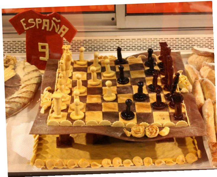
Pâtisserie gourmande en forme de jeu d'échec !

Le 07 et 09 septembre, plusieurs personnes ont la possibilité d'aller à la Foire Européenne découvrir, dans un premier temps, différents produits concernant la culture espagnole et dans un second temps, l'exposition sur les 100 ans du Concours Lépine !