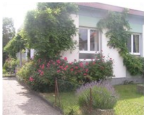
Antenne de l'IMP à WISSEMBOURG

Antenne IMP « Les Glycines » 73, Boulevard de l'Europe - 67160 WISSEMBOURG Pôle handicap 67