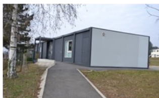
L'IMP à HAGUENAU