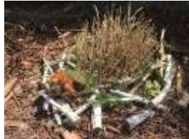
Création artistique présentée lors de l'exposition Land'Art dans les remparts de Neuf-Brisach

L'année 2016 du Service d'Accueil de Jour (SAJ) de Neuf-Brisach a été marquée par le transfert de son activité de l'Association Solidarité du Rhin Médico-Sociale vers l'ARSEA, et ce officiellement à compter du 1er juillet 2016. C'est à cette occasion, et pour conserver une certaine identité historique, qu'il a pris le nom de SAJ « Solidarité Du Rhin ».