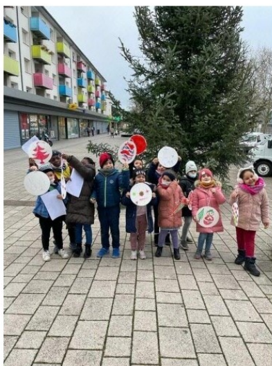
Décoration du sapin, ateliers bredele... Les animations se succèdent en cette fin d'année à la Cité de l'III.

Qui a dit qu'il ne se passait rien à la Cité de l'III ? Depuis quelques semaines, les animations se multiplient à l'initiative du comité d'animation du quartier lancé cet automne, en lien avec plusieurs partenaires. Sur le parvis de la tour Schwab, au 18 rue de la Doller ou à la maison de retraite Im Laeusch, animations portées par l'OPI/ARSEA, l'Association des Tchadiens et Guinéens, le Club des aînés et autres se succèdent. Mercredi dernier, une bourse aux jouets portée par les « Amis du cheval » animait ainsi le marché hebdomadaire ; dimanche à l'église Sainte-Bernadette, c'est au spectacle « La pastorale des santons de Provence » que les habitants étaient conviés.