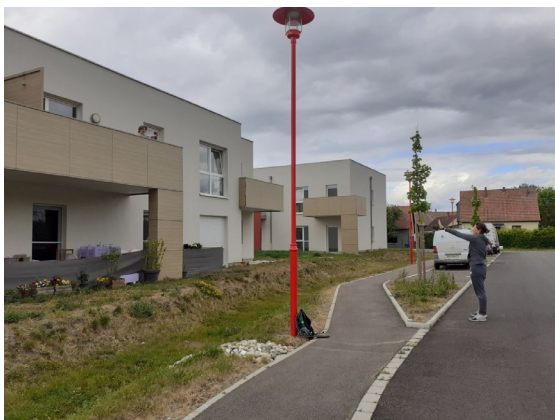
Gym au balcon