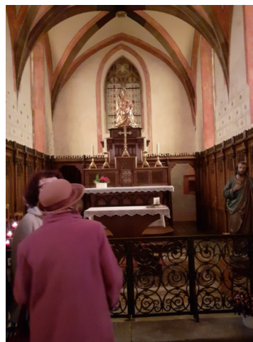
Sortie à la Chapelle de Hutenheim