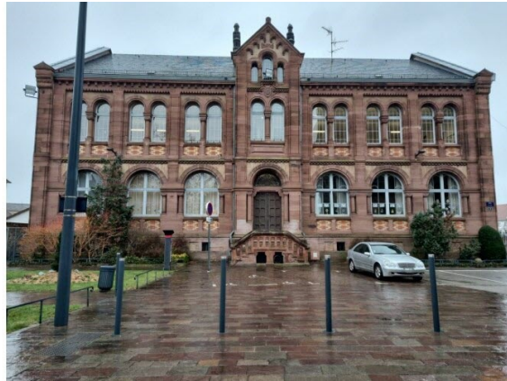
L'école élémentaire Saint-Georges sera concernée par des petits travaux de remplacement de portes en bois.

Entre 2024 et 2026, huit établissements scolaires publics, gérés par la Ville de Haguenau, seront rénovés : des travaux d'isolation, de pose de protection contre le soleil ou encore le remplacement de certaines portes seront menés durant les trois prochaines années.