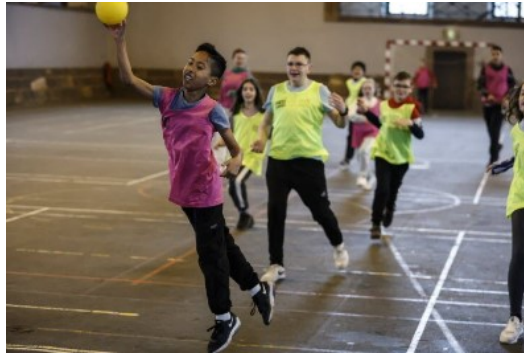
Plusieurs équipes s'affrontaient après les ateliers, lors d'un match.