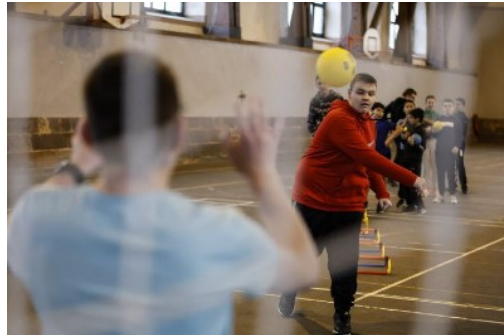
D'autres activités ont lieu à l'occasion de la semaine olympique et paralympique, dans les écoles haguenviennes.