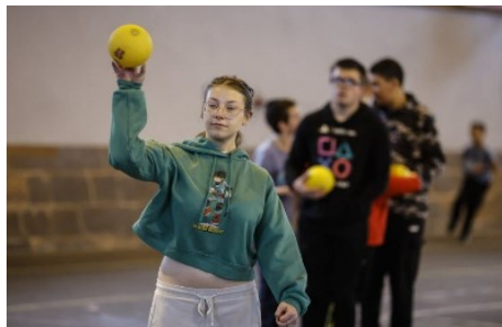
Une dizaine d'enfants du CME et 12 jeunes de l'IME avaient rendez-vous ce mercredi matin dans le grand manège de Haguenau.