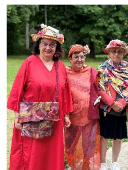
Partenariat DO UN DERT Défilé à Turkheim

En matière de santé, le CARAH travaille, entre autres, avec les services psychiatriques et les services de santé mentale, ainsi qu'avec les services d'aide à domicile.