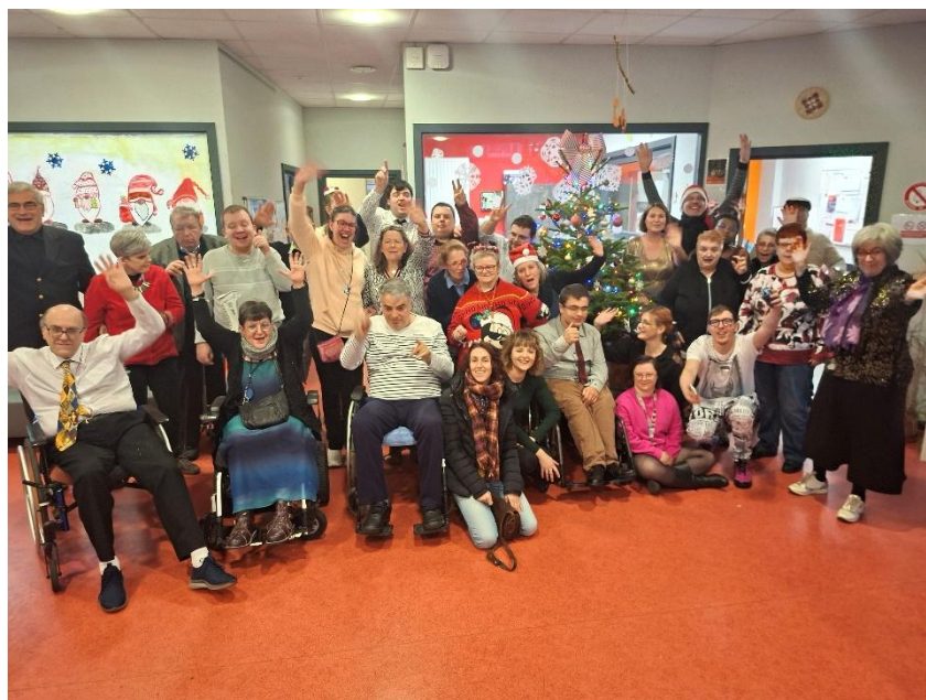
Fête de Noël 2025

Les salariés créent tout au long de l'année des outils : tableaux, visuels, pour permettre aux bénéficiaires de s'exprimer et de comprendre l'environnement dans lequel ils évoluent.