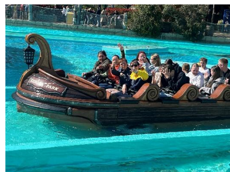
Europa Park 10 avril 2025