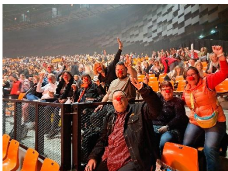
Concert de Soprano 15 novembre 2025

Concerts, séjours, activité théâtre, activité piscine, ateliers musique, broderie, sorties... autant de moments partagés pour favoriser le bien-être, l'autonomie et la convivialité.