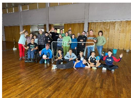
Rencontres régulières avec l'équipe U13 de handball du HCVM

Tous ces partenariats favorisent le développement du lien social et valorisent les actions des bénéficiaires au quotidien.