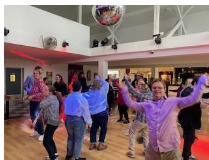
Sortie Collis Martis